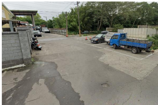
富源汽機車回收處理廠前門口