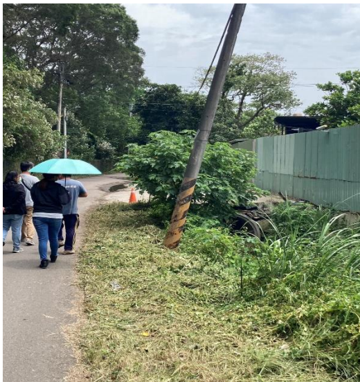
名鴻環保工程有限公司前鐵皮