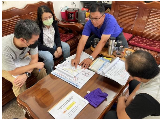
與里民說明本工程