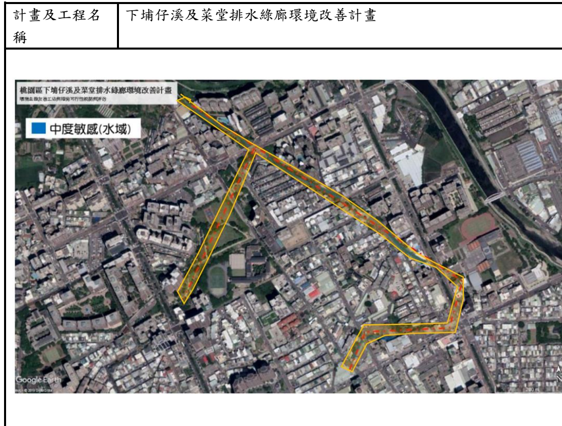
附表 P-02 施工擾動範圍圖