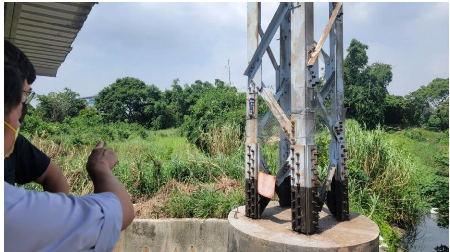
高壓電塔現場照片