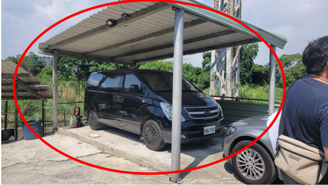
高壓電塔遷移至堤內(八德區大明段 1118 地號公有土地)位置及土地佔用物情形