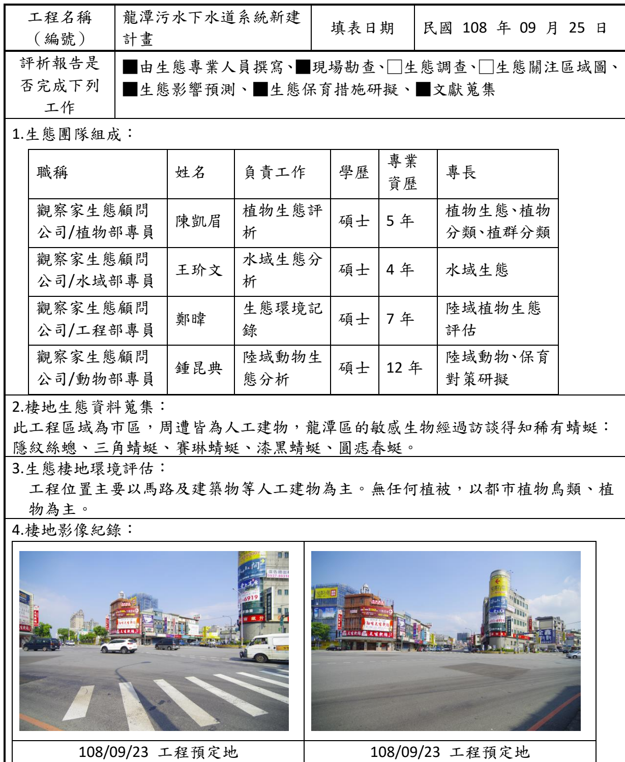
附表 D-03 工程方案之生態評估分析