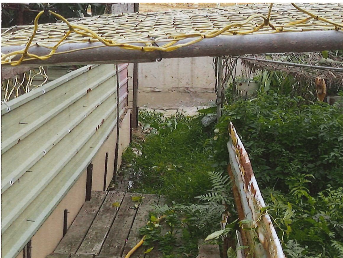
B0K+280 魚池的水路屆時接入明渠外水利溝