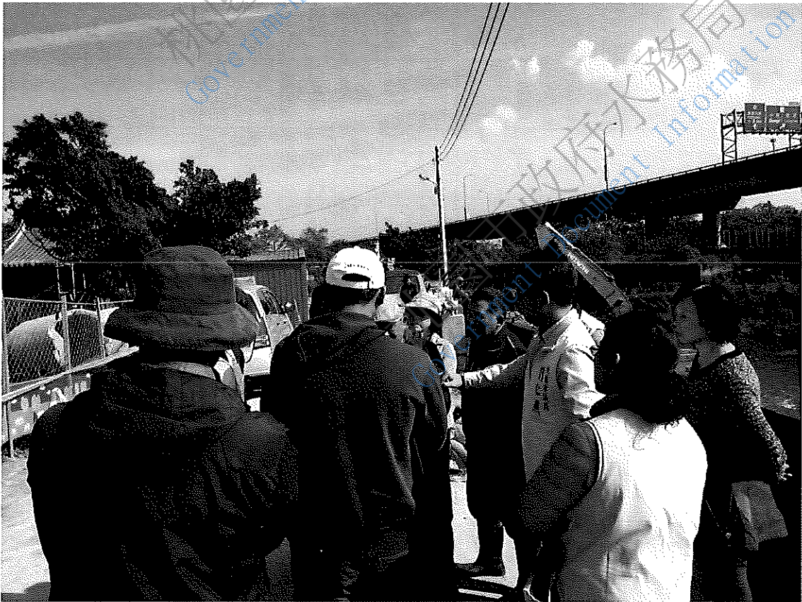
圖二. 現況討論照片