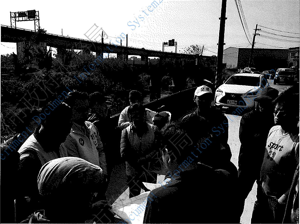
圖一. 現況討論照片